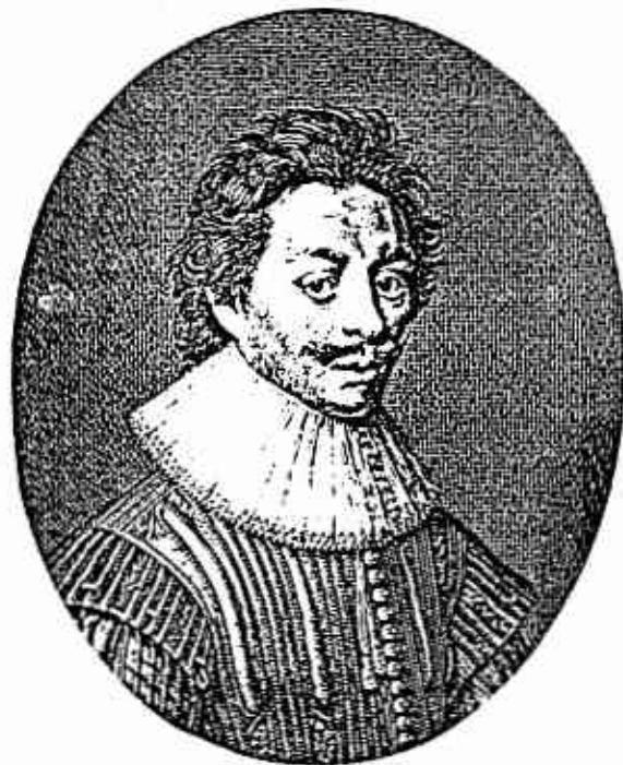
Constantijn Huygens Ets naar een schilderij van M. Miereveld.

Wat had de familie Huygens met Voorburg? Waarom bouwde Huygens zijn buitenhuis Hofwijck juist in Voorburg? Hoe bracht hij de tijd gedurende zijn verblijf op Hofwijck door? En zo zijn er nog talrijke vragen te bedenken. In dit Huygensjaar - 400 jaar geleden werd